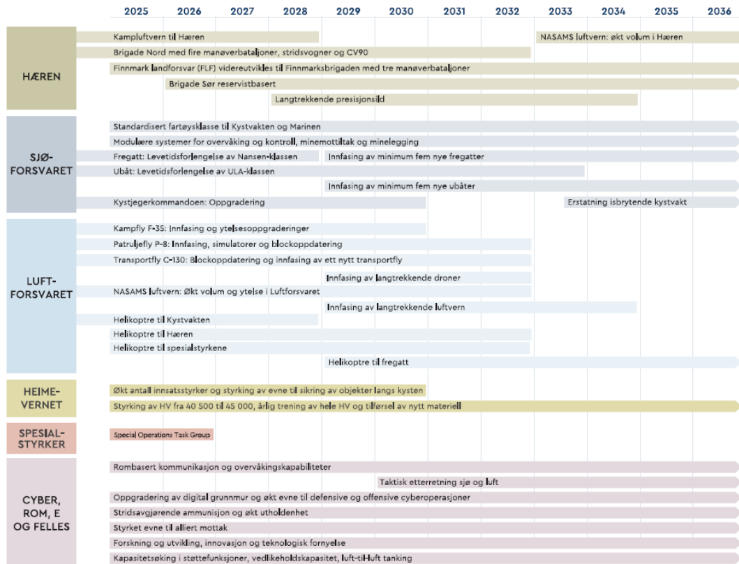
Planlagt utvikling fra 2025